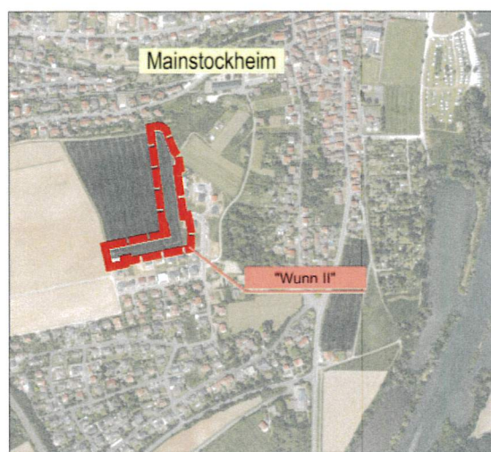
Lagepläne ohne Maßstab